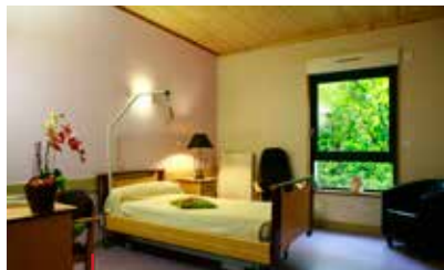
Chambre unité Alzheimer